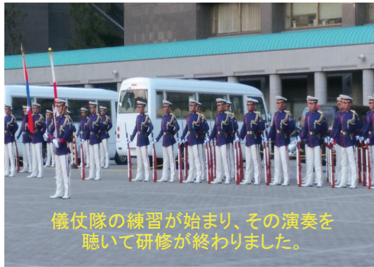
儀仗隊の練習が始まり、その演奏を 聴いて研修が終わりました。

今回は、普段暴力団等排除のために連携している他業種の方々との交流を深め、かつ、基地の町でもある立川とは縁の深い防衛省を見学するという研修でした。国防の機密保持のため参加人数を絞らざるを得ないということもあり、少数での参加となりましたが、これからこの経験が何らかの形で支部活動に行かせることができればと思っております。(笹本)