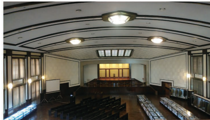
精確に再現された大講堂。極東国際軍事裁判（東京裁判）の法廷となつたところです。

行政書士会以外にも様々な他業種の方々が多数参加して行われたこの研修会では、防衛省の敷地内の一般に開放されている棟を順に見学して、往復のバスの車中で暴力団排除のためのDVDを視聴するという充実した内容でした。